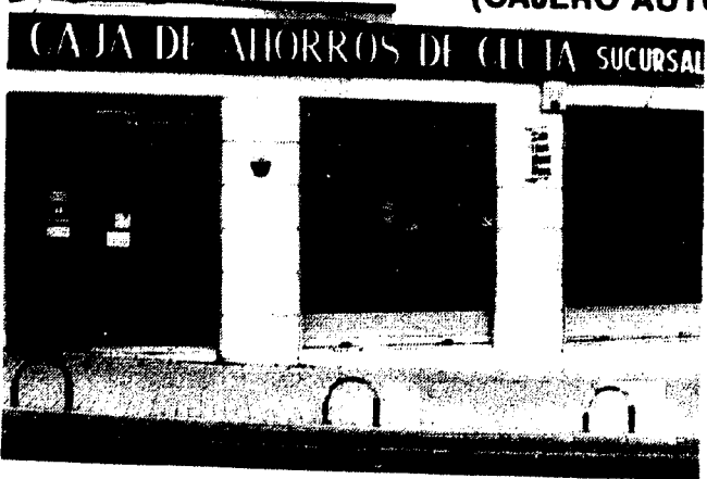
URBANA NUM. TRES Barriada de Villa-Jovita