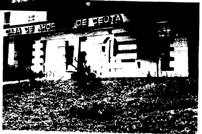
URBANA NUM. CUATRO Polígono Virgen de Africa