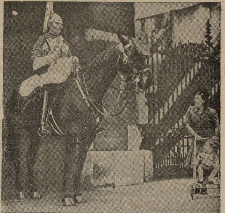
Al cabo de cierto tiempo, los coraceros ingleses, con sus brillantes uniformes, vuelven a prestar guardia. La vieja tradición, remozada, ha despertado gran interés entre la población londinense.