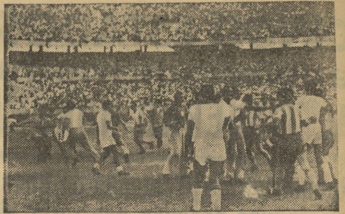
Esta foto hará enmudecer a los partidarios fogosísimos de nuestros Tomelloso, Eldense, Alcoyano y tantos otros de todas las Divisiones. Pero no se trata esta vez de terrenos modestos ni de ninguna promoción liguera. Se trata nada menos que de la final disputada entre Argentina y Brasil, que terminó con la victoria del equipo del Plata.

Esta vez la Policía no precisó, sin embargo, de los gases para calmar a la "hinchada". La contundencia muscular se redujo a la cancha, donde la actividad bélica desplegada por los 22 jugadores, el árbitro y el correspondiente retén policiaco, fué observada pacientemente por los de tribunas y graderíos.