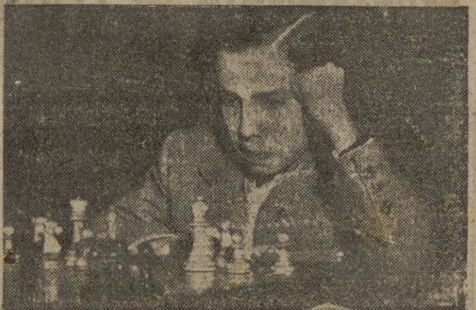
INFORMACION EN LA PAGINA CINCO.