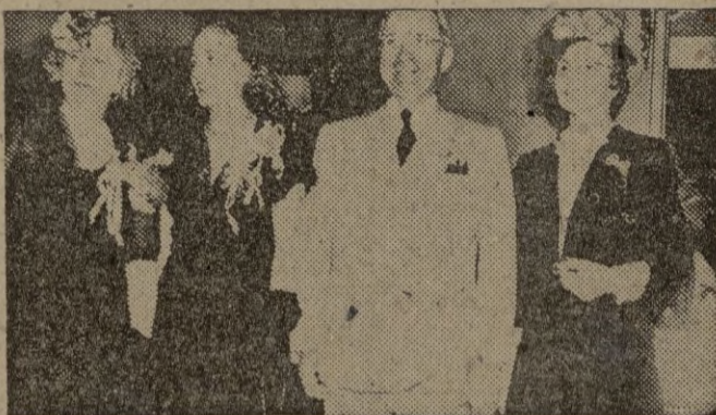
El presidente de los EE. UU., Truman, acompañado de su familia --su hija, su esposa y su hermana-- que habitan actualmente en la Casa Blanca, residencia que antes ocupara el presidente Roosevelt, su antecesor.