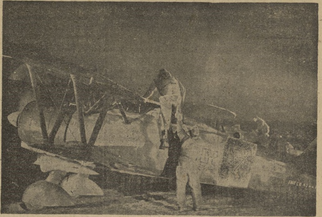
Se aproximan bombarderos e enemigos. Al recibirse la información despegan los cazas italianos para enfrentarse con el enemigo. ...

Juventudes Femeninas de Alemania e Italia. La formación de un triunvirato, con el fin de orientar a la educación hacia el hogar de todas las juventudes femeninas europeas y a la inauguración del Castillo de la Mota, como escuela mayor de mandos, donde de todas las provincias, tienen un ejemplo vivo de lo que deben hacer con sus escuelas menores.