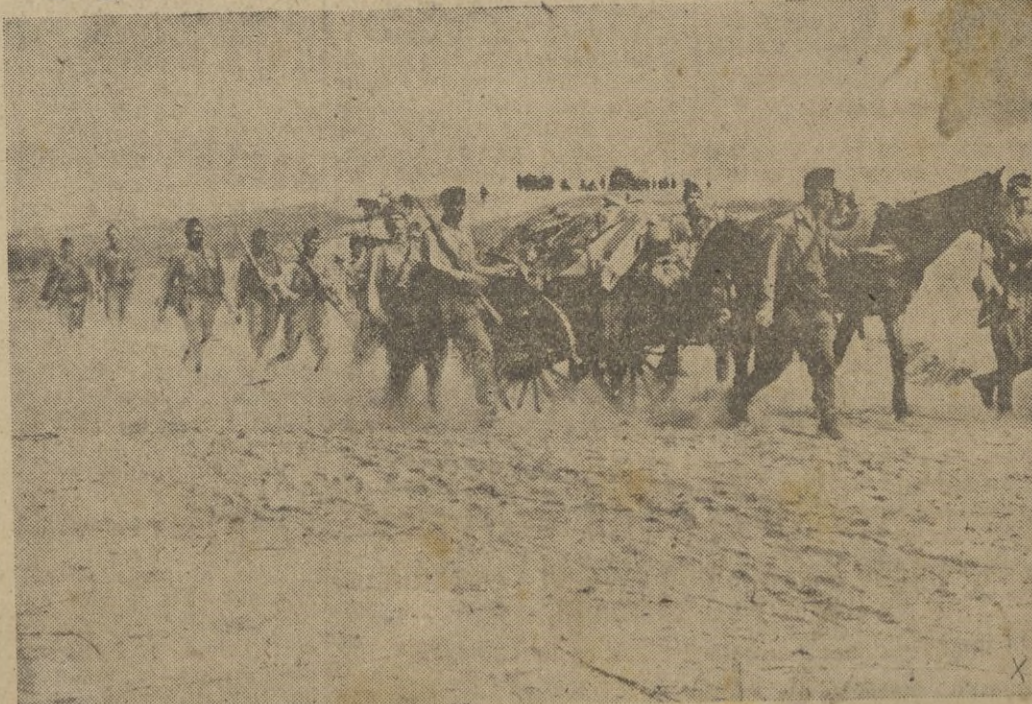
En medio de un calor sofocante lo que parece mentira en Rusia, marchaban así, hace unos meses, las columnas hacia el Don, hoy cubierto de nieve.