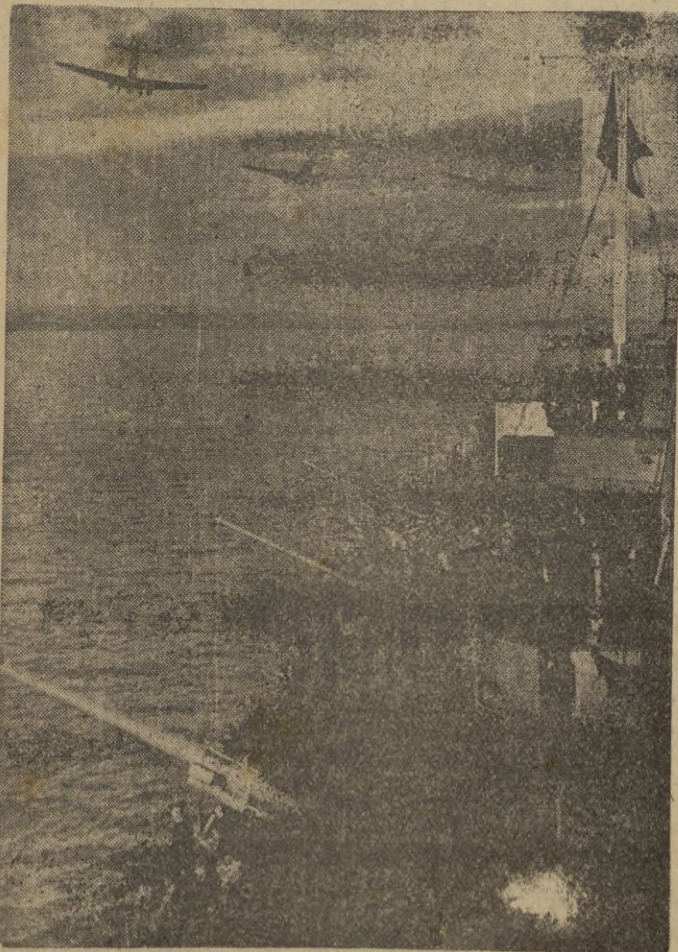
Los barcos de guerra protegidos por dos cazas, patrullan .. cerca .. la costa