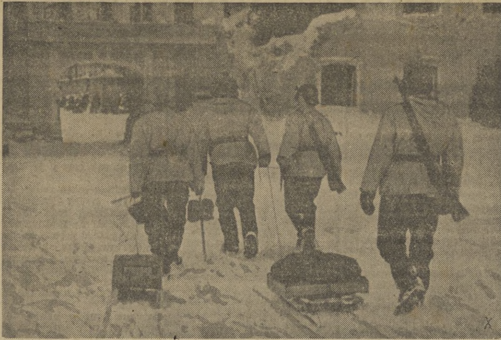
Los soldados de la nueva Europa, con sus pequeños trineos de víveres y municiones, pasan por los patios de los antiguos castillos de los zares

momento presente llevan efectuadas las delegaciones de las Falanges del Mar, estableciéndose asimismo nuevas directrices para seguir por estas y para mejorar la tarea que a las mismas están encomendadas. — CIFRA