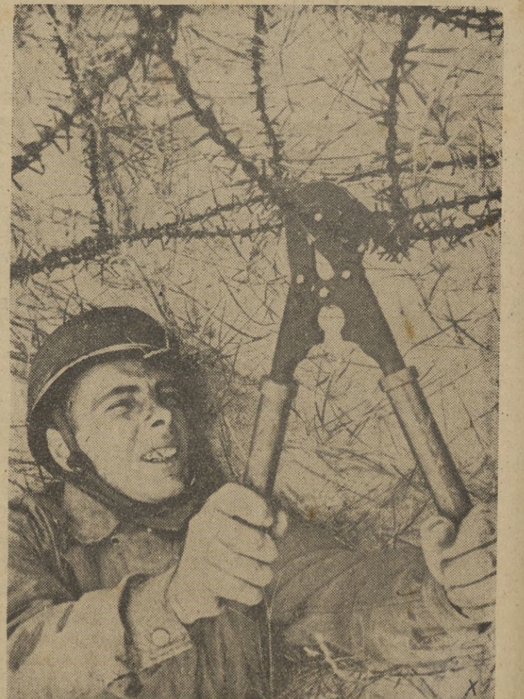
El primer paracaidista arribado entre las alambradas para el camino para los camaradas siguientes