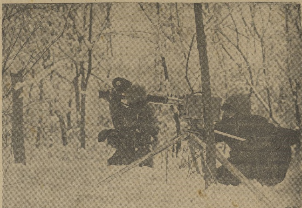
Los operadores cinematográficos se disponen a tomar las escenas de la guerra