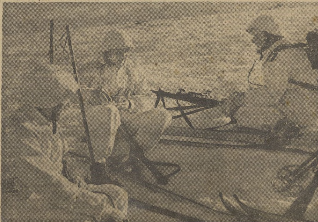
Una avanzadilla de esquiadores, descansa en su marcha por el Cáucaso.