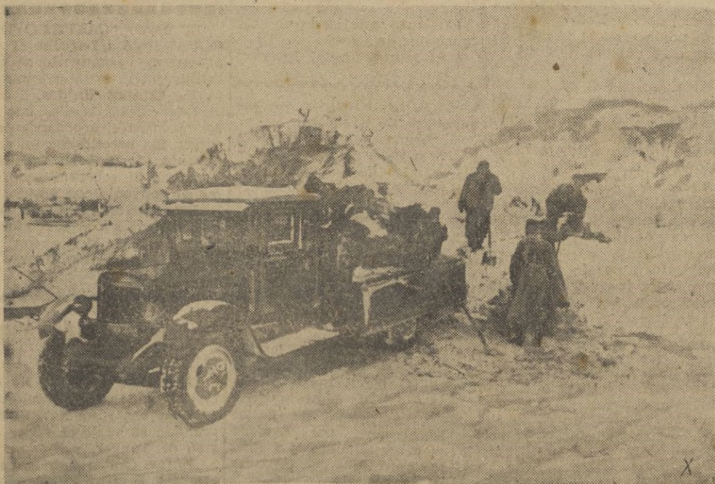
Algunas pistas de hielo hay que cubrirías con arena para el paso de los vehículos.