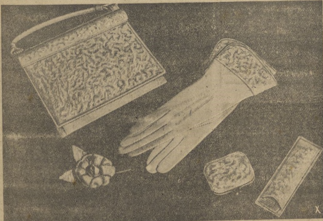
He aquí el complemento del vestuario de una mujer elegante. Todo construido con la misma piel y en el mismo tono. El "clip", puede ser dorado, o mejor aún, fosforescente.

MASAJE "FLOID". - HAUGROQUINA "FLOID" "Perfumería VICENTE MARTINEZ. - Puente Almira número 6"