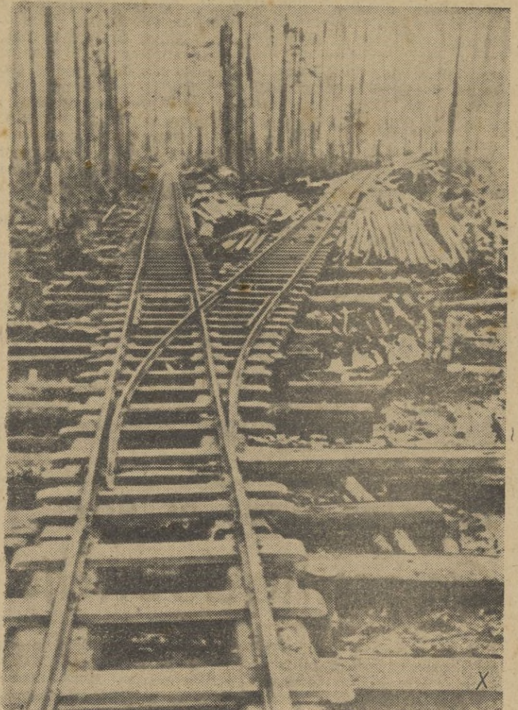
La construcción de este ferrocarril de 22 kilómetros hasta el mismo frente, ha requerido el empleo de 22.000 travasas y 15.000 quintales de grava