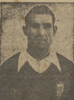
Comas, Telechía, Melul y Morla, sobre los que se prodigan los más favorables comentarios por su actuación en Chamartín

El arbitraje del señor González fué discreto. — MENCHETA.