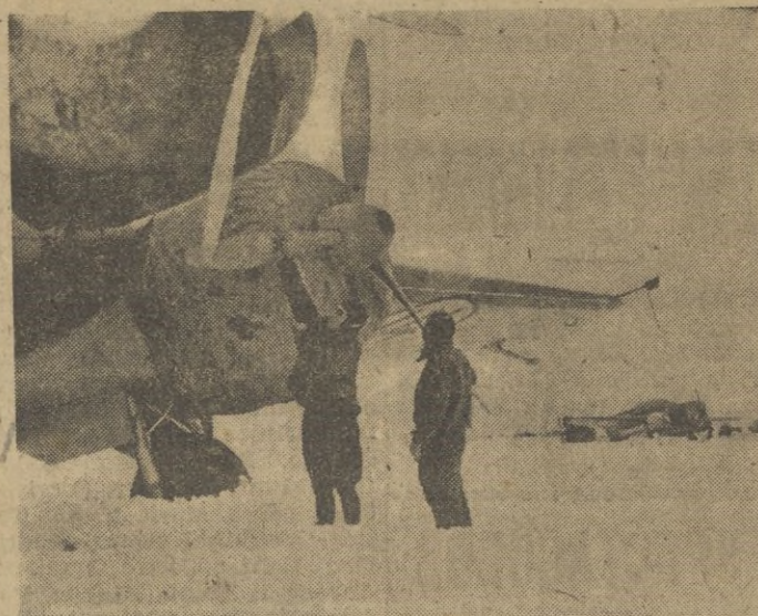
La nieve no interrumpe la actividad de guerra de los bombarderos italianos en el frente