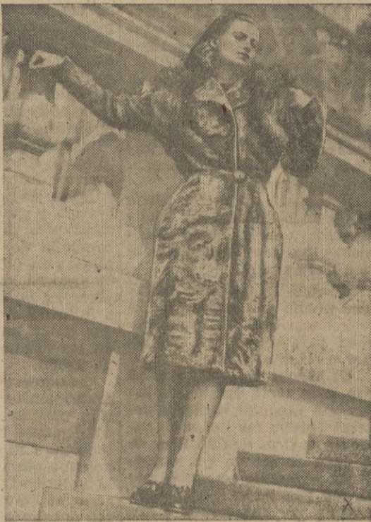
Abrigo de Persiana gris, pieles bien dibujados, con collar grande de zorra plateada, para la tarde.