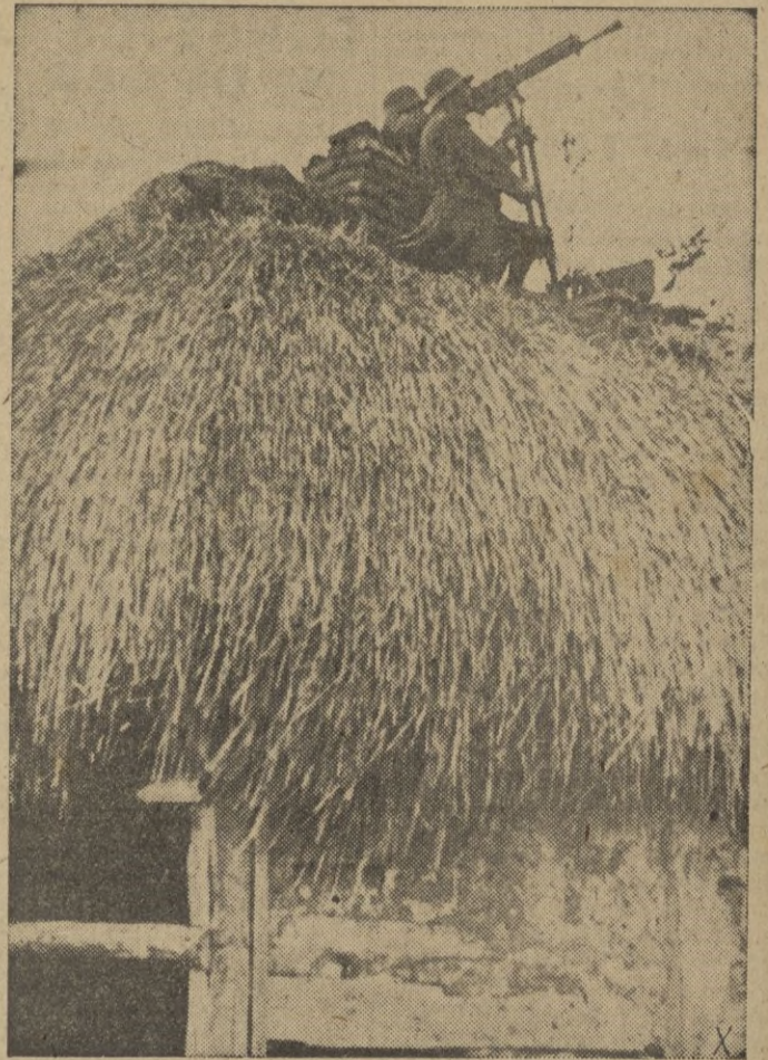
Puesto de ametralladora húngaro en el frente ruso.

yectada salida de la flota mediterránea francesa y desmovilización de los contingentes poco seguros del ejército francés.