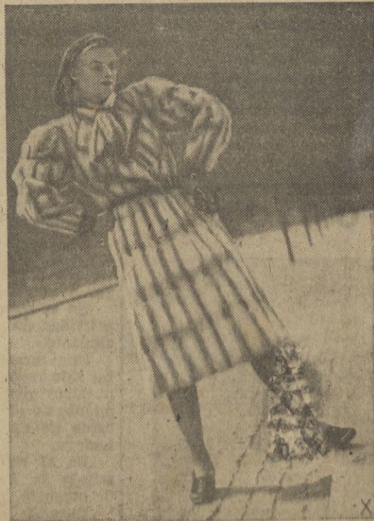
Abrigo de Bisampecho, piteos elegidas de igual color y dibujo, trabajados en filas; mangas anchas y corbata de piel.