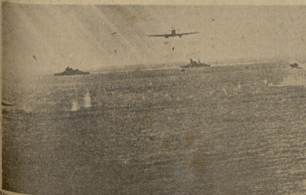
Ataque de aviones torpederos italianos a una formación naval anglo-americana cerca de la costa argelina: lanzamiento de un torpedo contra un buque enemigo.