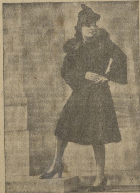
Abrigo de Persiana, bien dibujado, cinturón y cuello redondo.