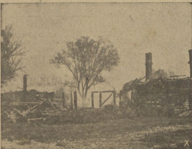
Otra aldea sucumbe bajo la tea incendiaria de los bolcheviques.