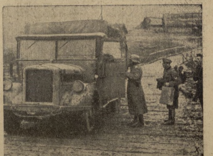
Un policía militarizado regula el tráfico por esta carretera rusa reforzada con troncos de árboles.