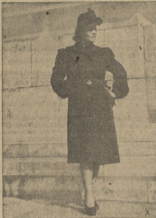
Abrigo de Persiana extrafino, muy entallado, collar de zorra plateada para la tarde