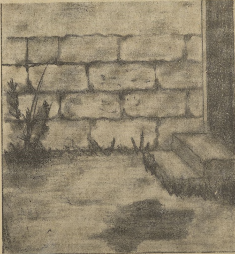
La sangre de José Antonio, dejó para siempre en este lugar la señal indeleble del sacrificio.

Y en lo social? ¿Se hizo la reforma agraria? ¿Se hizo la reforma crediticia? Ya sabéis que la reforma agraria que presentaron los hombres del 14 de abril en vez de ir como la que nosotros apetecemos, a rellenar de sustancia al hombre, a volver a dotar al hombre, de su integridad humana, social, occidental, cristiana, española, en vez de hacer eso, tendió a la colectividad del