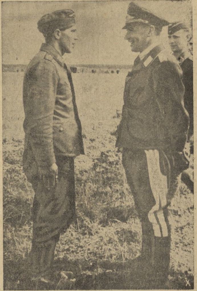
El artillero de un antiáereo que mantuvo en jaque a un grupo de tanques soviéticos es felicitado por el jefe del aerodromo de campaña

Madrid, 19. 23. — Diez mil pesetas para el aguinaldo de la División Azul destina la Comisión Municipal Permanente, según la moción aprobada en la sesión celebrada esta mañana. — CIFRA.