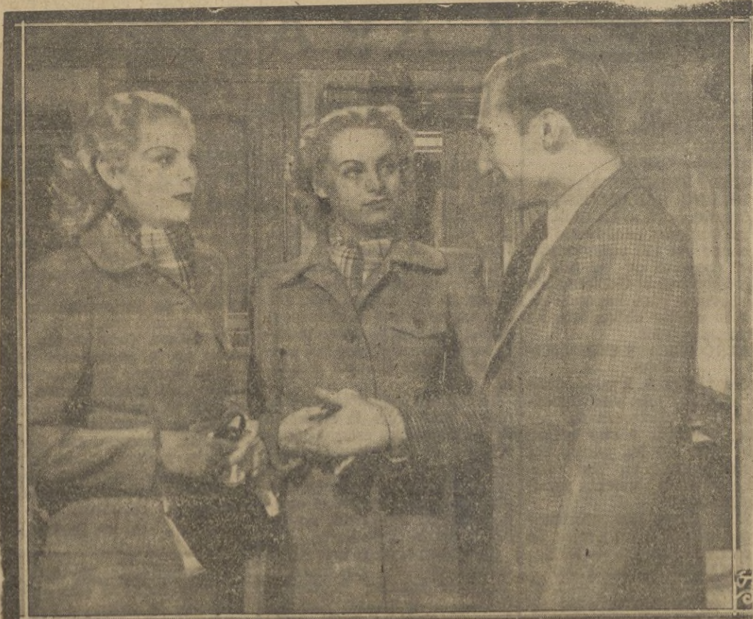
Una escena de "Muchachas de uniforme".

1.100 vendidos a 30 delegaciones provinciales. Vacante Ceuta comprando 10 Tarifa Oficial gran descuento. Apartado 66. San Sebastián.