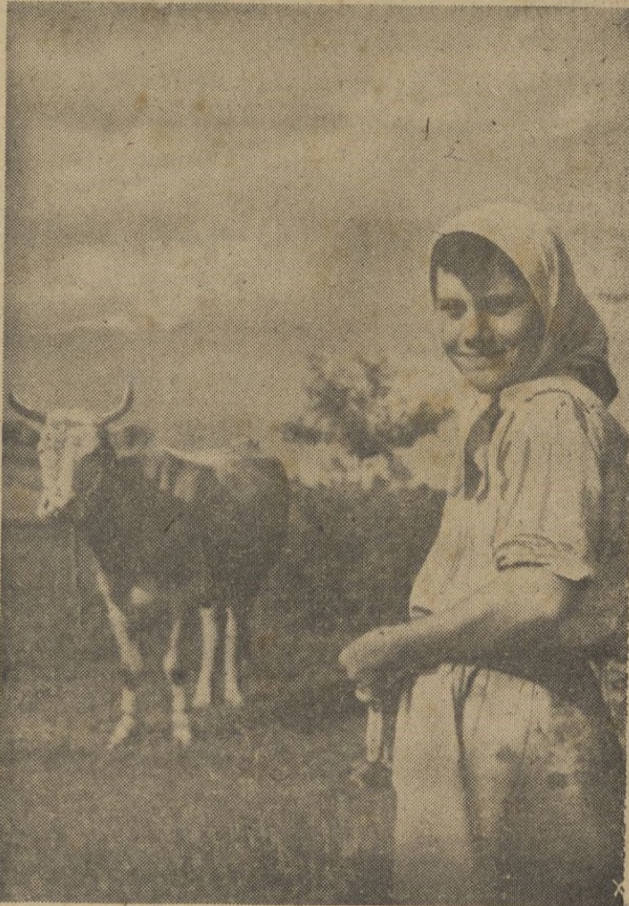
La hija del granjero ruso es sorprendida por el fotógrafo cuando se entrega a su labor de apacentar el ganado, en este cuadro bucólico, por donde pasó la guerra y que ya está ganado para Europa.