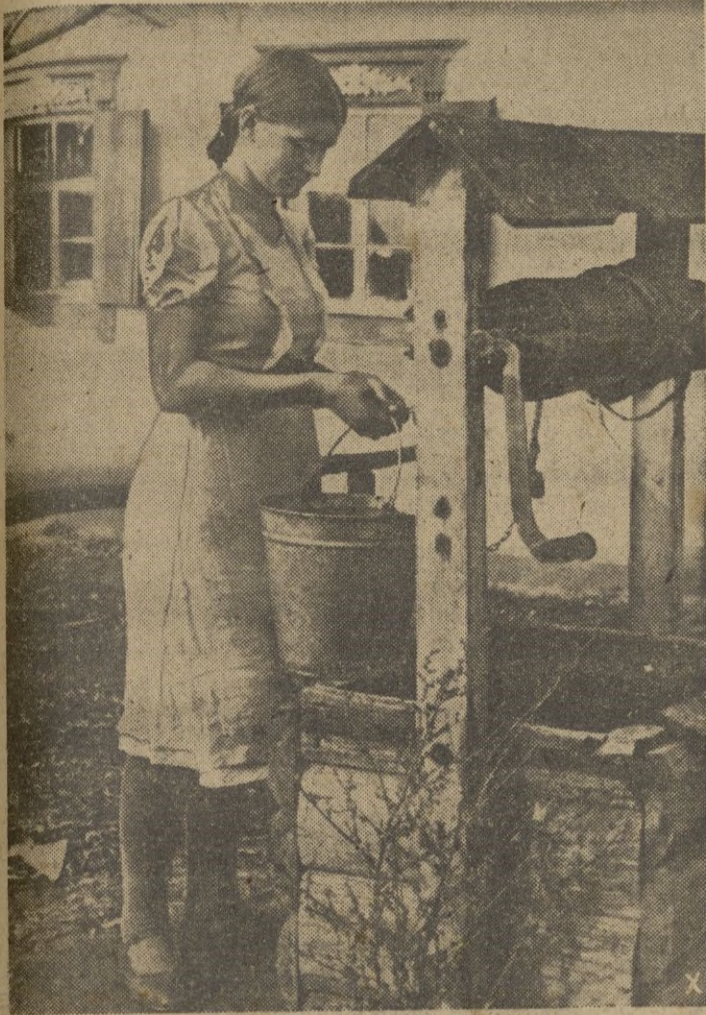
Una joven campesina de las hermosas tierras negras, saca con la garrucha agua del pozo, en la paz lograda de ese país incorporado por las armas a la nueva economía del Continente unido.