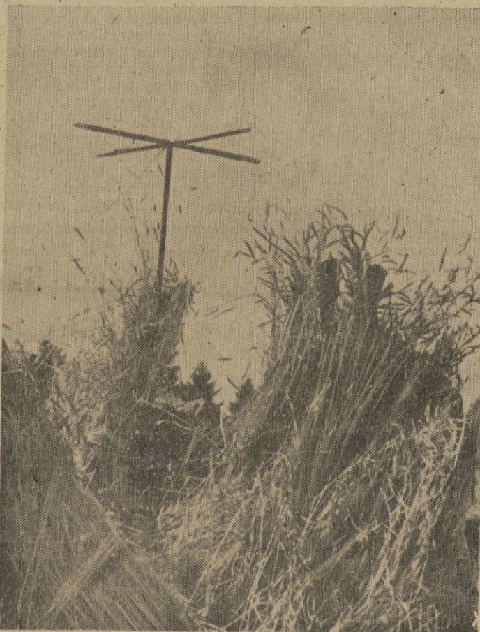
Un periscopio con sus ojos mira a través de las gavillas que se esconden. Allí encima, la cruz de una antena de radio.