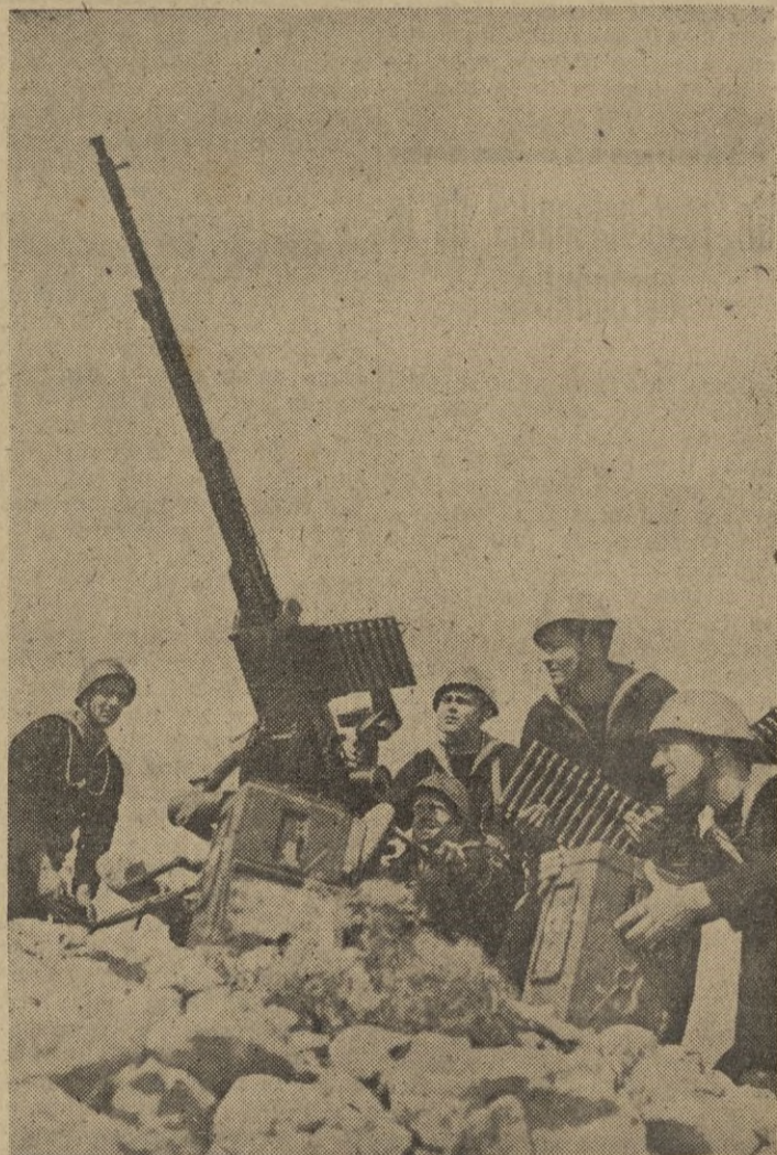
Artillería antiaérea de la Marina italiana en una isla del Egeo.