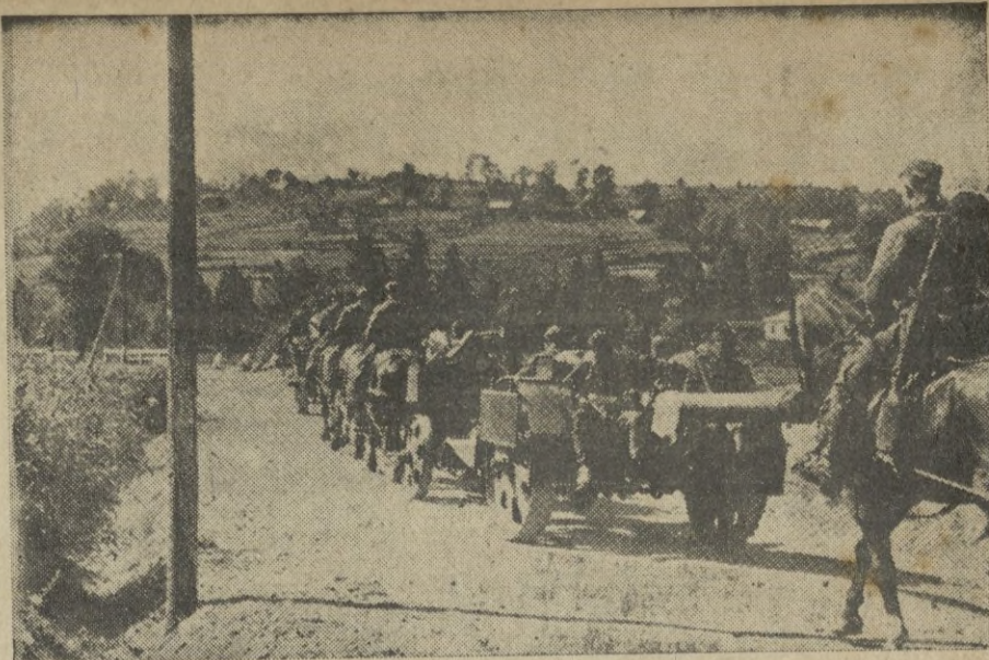
Artillería alemana, camino de nuevo emplazamiento.

Los rompe-hielos hacen los más grandes esfuerzos para derribar los grandes bloques de hielo que se hallan sobre el río Bal. Las casas de las inmediaciones se encuentran en situación tan peligrosa, que se están eva-