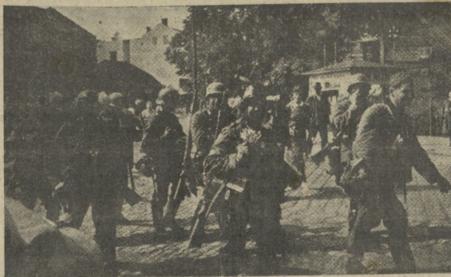
Soldados alemanes, que al dirigirse al frente les son ofrecidos ramilletes de flores.

Número premiado en el sorteo de ayer el 97.