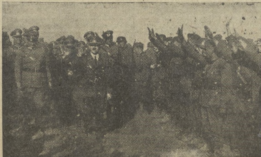
El Führer Canciller visita un frente de batalla.