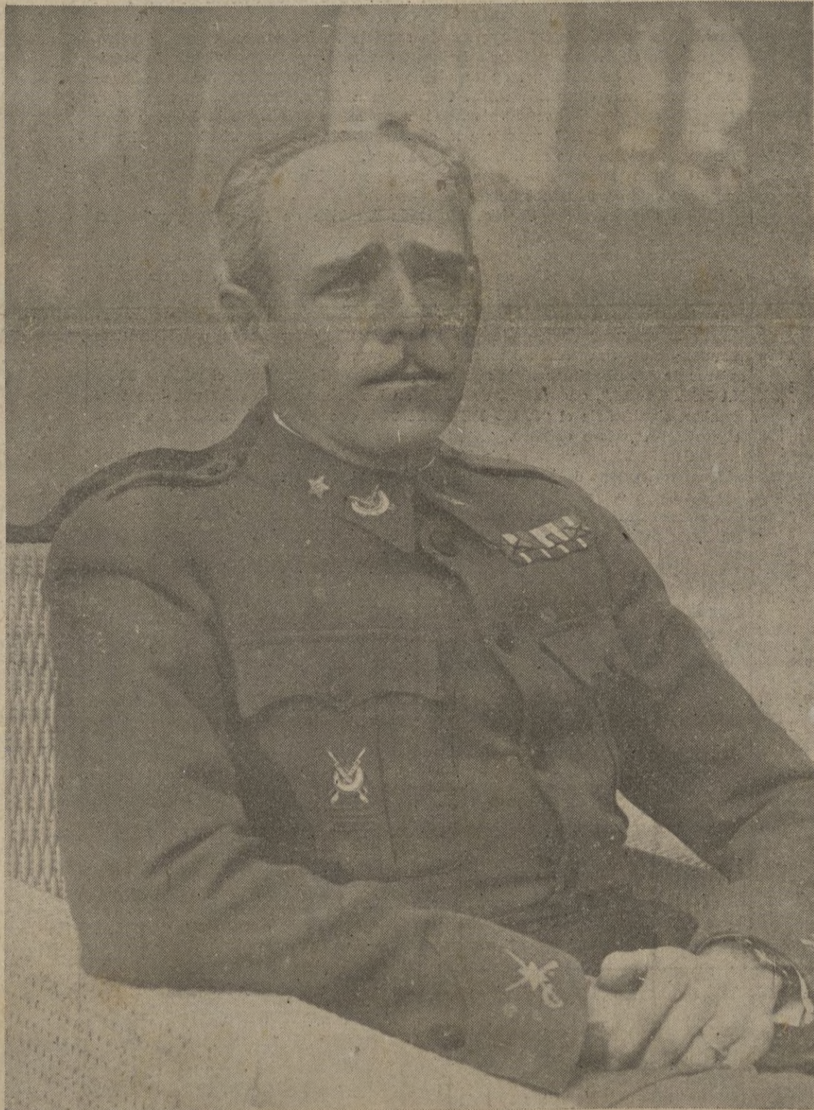
S. E. el Alto Comisario de España en Marruecos y Gobernador de las Plazas de Soberanía, General Asensio, de cuya llegada a Ceuta para posesionarse de su elevado cargo, hoy se cumple un año.

Madrid, 22. — En vista de la disminución del tráfico y a consecuencia de la restricción de gasolina, a partir de septiembre los Agentes de tráfico regularán la circulación disminuyendo e incluso se llegará a la supresión de señales luminosas. CIFRA.