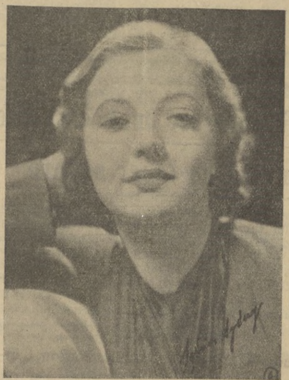
SILVY SIDNEY lleva, con sus bellos ojos rasgados, toda la melancolía de las hijas del Sol Naciente, en cuyas caracterizaciones ha logrado triunfos magníficos.