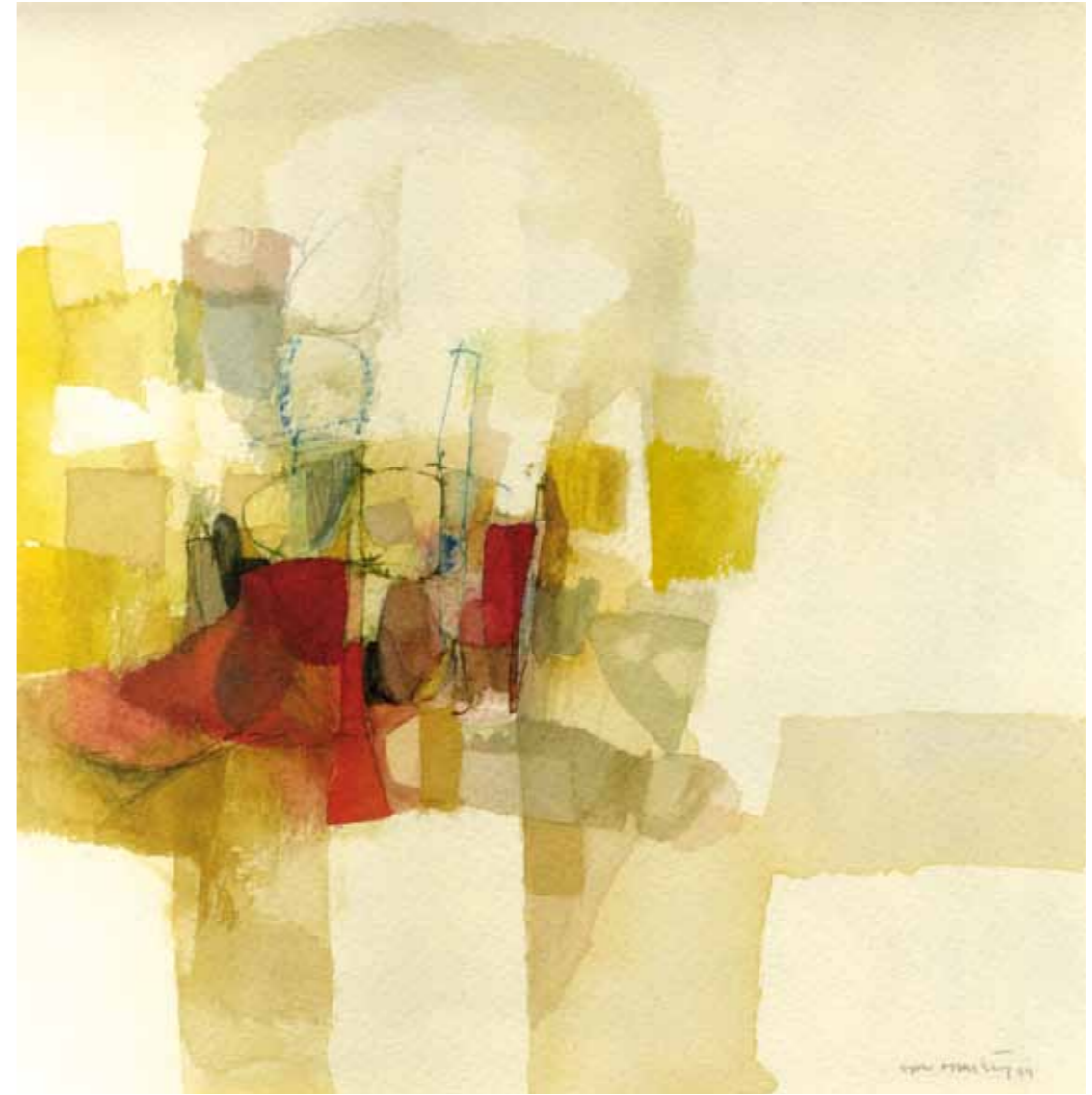
Mesita de té Acuarela sobre papel 15 x 20 cm.