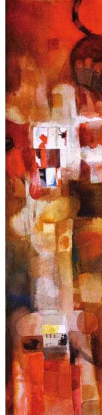
Estela nº 4 Acuarela y collage 20 x 70 cm.