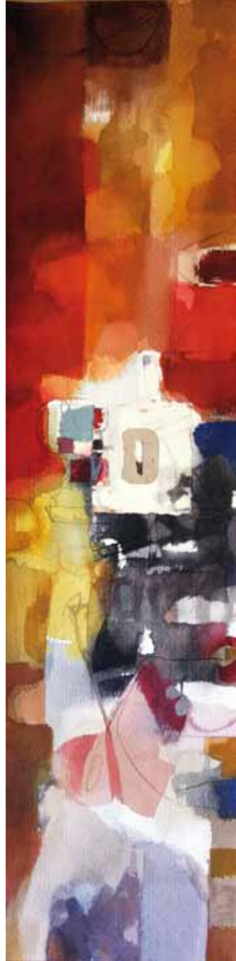
Estela nº 1 Acuarela y collage 20 x 70 cm.