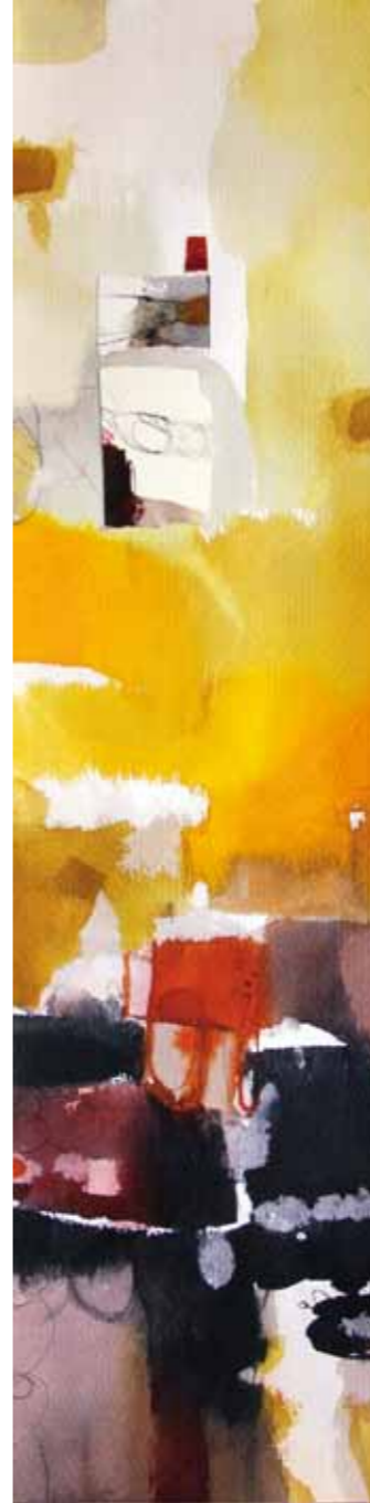
Estela nº 3 Acuarela y collage 20 x 70 cm.