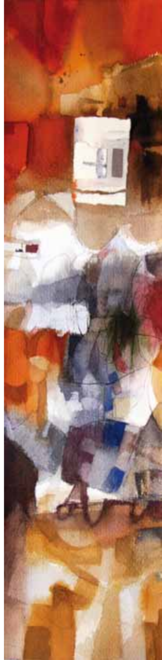
Estela nº 2 Acuarela y collage 20 x 70 cm.